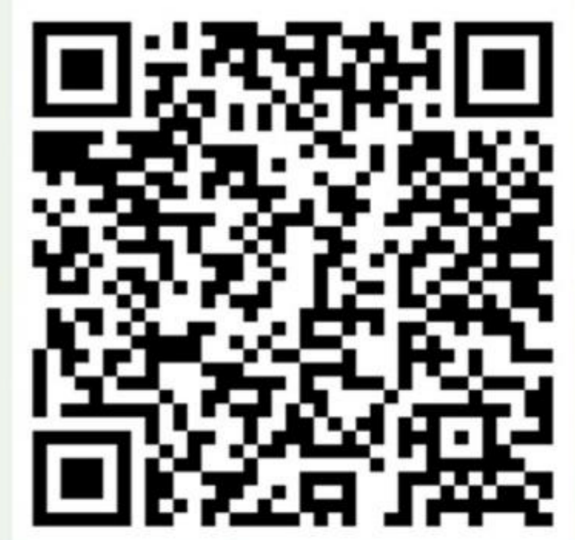
การออมเงินฝากประเภทออมทรัพย์ (เล่มโครงการสหกรณ์)